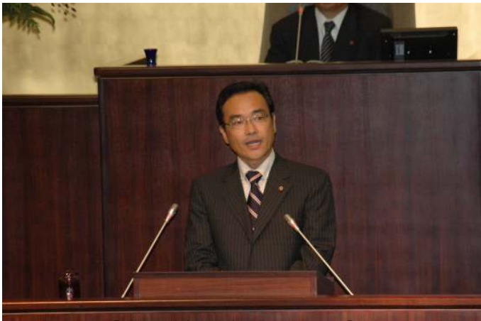
【定数削減案の賛成討論を行いました】